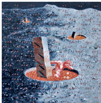
ZDRAVKO MILIĆ, Dantedrom V , cm 90 x 90, acrilico su tela, 2020

so sensibile, ma anche e soprattutto all'area rarefatta di un pensiero, dove fluttuano ininterrottamente capacità di ascolto delle emissioni più misteriose della fisicità, prontezza a cogliere il senso dell'esistenza, la fibrillazione intellettuale continua intorno agli interrogativi anche più problematici della contemporaneità.