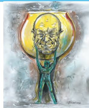
LORELLA FERMO, Anselm l'alchimista , cm 21 x 15, tecnica mista su carta, 2026

Spunti e contrappunti di arte, letteratura e critica culturale