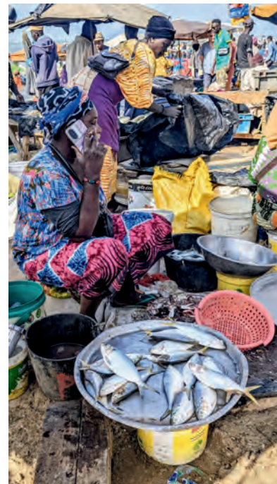
Mercato del pesce

“Africa mia Africa / Africa di fieri guerrieri nelle savane ancestrali/Africa di cui canta mia nonna / Sulle rive del suo fiume lontano / Non ti ho mai conosciuta / Ma il mio sguardo è pieno del tuo sangue / Il tuo bel sangue nero versato sui campi / Il sangue del tuo sudore / Il sudore del tuo lavoro/ Il lavoro della schiavitù / La schiavitù dei tuoi figli / Africa dimmi Africa / Sei dunque tu questa schiena che si piega / E si adagia sotto il peso dell'umiltà / Questa schiena tremante con strisce rosse / Che dice sì alla frusta sulle strade a mezzogiorno / Allora gravemente una voce mi rispose / Figlio impetuoso questo albero robusto e giovane / Quell'albero laggiù / Splendidamente solo tra i fiori bianchi e appassiti/ È l'Africa la tua Africa che ricresce / Che ricresce pazientemente ostinatamente / E i cui frutti hanno a poco a poco / Il sapore amaro della libertà”.