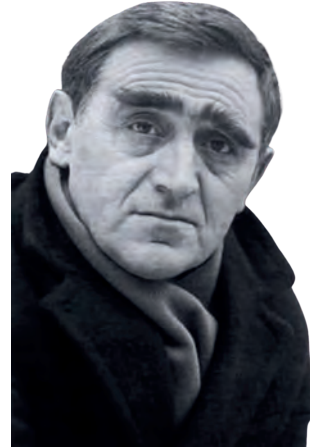
Il poeta ceco Jan Skácel

Nella società moderna, malata di consumismo e di violenza, i valori della poesia continuano ad esistere. Finché ci sarà un poeta, la poesia mostrerà la sua luce ed offrirà strade di speranza a chi in "lei" e per "lei" saprà elevarsi dall'appiattimento del quotidiano e colmare i deserti della vita.