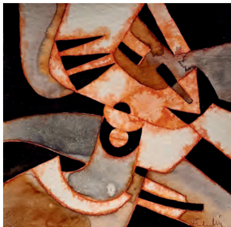
BRUNO PALADIN, Geoplan alieno , cm 30 x 30, acquerello su carta riciclata, 2025

mata tensione della sua ricerca sulla superficie e nello spazio tridimensionale ha il centro propulsore nella pittura, dove la sua vena poetica si sbizzarrisce con una serie cospicua di supporti che vanno dal legno al metallo, dal polistirolo alla carta. Le opere qui esposte, con esiti di marcata novità, si riconnettono direttamente a quelle del ciclo “Geoplan”, concepite da Paladin durante la