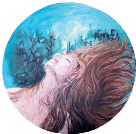
OSCAR VANNI GERETTI, La coscienza dei desideri , diametro cm 85, acrilico su tela, 2025

senza di un problema; questa fa vagolare in un labirinto di sollecitazioni fuori dalla portata dello sguardo e della ragione. Pertanto l'involucro scuro di brani di cartone indica la mancanza di una fisionomia precisa e l'assenza di quella luce che serve a illuminare il cammino di relazione con le cose, le persone, le situazioni.