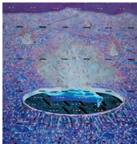
ZDRAVKO MILIĆ, Dantedrom IV , cm 90 x 90, acrilico su tela, 2020

Tra le grandi mostre allestite nello spazio espositivo dell'Azienda Pubblica di Servizi alla Persona di via Pascoli a Trieste, c'è quella di Zdravko Milić e Bruno Paladin, artisti croati di livello internazionale che nell'ambito di una medesima rassegna, "Dal reale al fantastico", dal 13 aprile all'11 maggio presentano due mostre: l'una dal titolo "Il viaggio d'arte nell'altrove" e la seconda "Geoplan come landa di serenità", che si fronteggiano e "dialogano" tra loro.