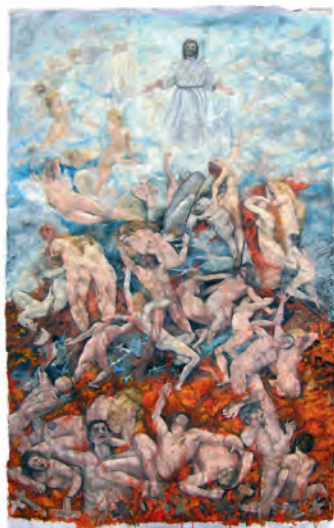
OSCAR VANNI GERETTI, Il giudizio universale , cm 180 x 120, acrilico su carta, 2019

L'attività creativa è da sempre un modo per conoscere se stesso e le proprie potenzialità.